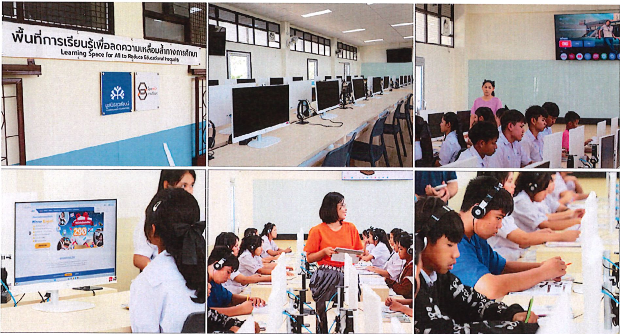
ภาพพื้นที่การเรียนรู้ยุคดิจิทัลไร้ขีดจำกัด

นอกจากนี้โครงการร้อยพลังการศึกษา มูลนิธิเพื่อคนไทย ยังร่วมสนับสนุนในมิติการพัฒนาคุณภาพสภาพแวดล้อมการเรียนรู้ ซึ่งอยู่นอกเหนือกรอบการส่งเสริมของ BOI เพื่อปรับปรุงสภาพแวดล้อม และเสริมอุปกรณ์ในห้องเรียน เพื่อให้เด็กนักเรียนมีพื้นที่การเรียนรู้ที่เหมาะสมและมีประสิทธิภาพ และเสริมสร้างทักษะด้านเทคโนโลยีที่จำเป็นต่อการเรียนรู้ในอนาคต