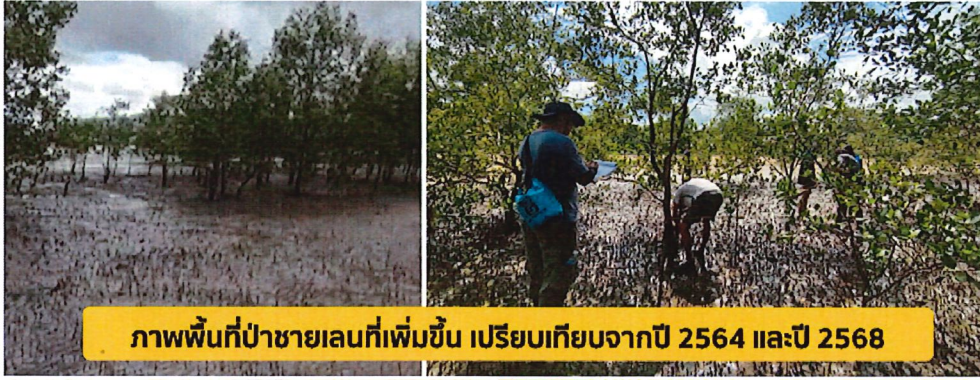
ภาพพื้นที่ป่าชายเลนที่เพิ่มขึ้น เปรียบเทียบจากปี 2564 และปี 2568